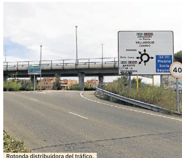
Rotonda distribuidora del tráfico.

cas y Cigales afecta sensiblemente a Arroyo de la Encomienda y a sus vecinos. Las alegaciones presentadas instan a revisar el estrangulamiento que se produciría en La Vega y sus accesos, dificultando el tráfico, que aumentaría especialmente con el pesado al desaparecer uno de los accesos principales, desviar el tráfico y seguir sin permitir una salida natural hacia el norte por la A-62. En la actualidad solo existe salida en dirección sur y así parece que seguirá salvo que prosperen las alegaciones presentadas por el Ayuntamiento de Arroyo al proyecto que quita el sueño a los más de 21.000 vecinos del municipio.