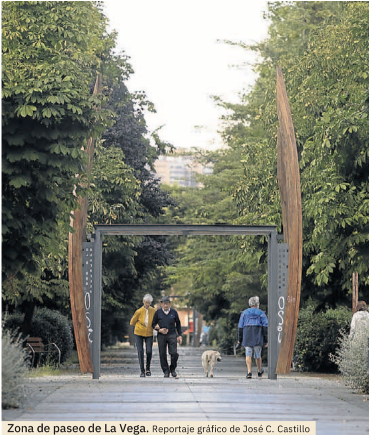
Zona de paseo de La Vega.

el tenis y el pádel acaparan el protagonismo de Vega Sport.